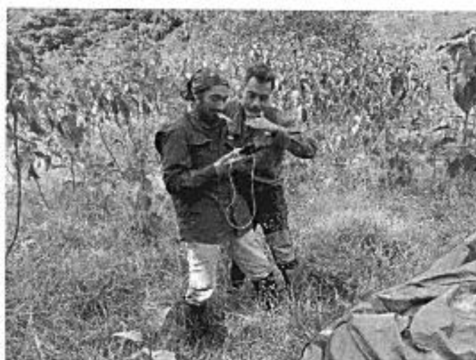
Equipo técnico del componente de herpetología