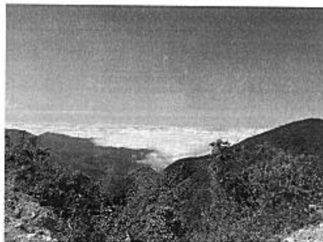
Sitios de muestreo en la localidad de Chilla-El Oro