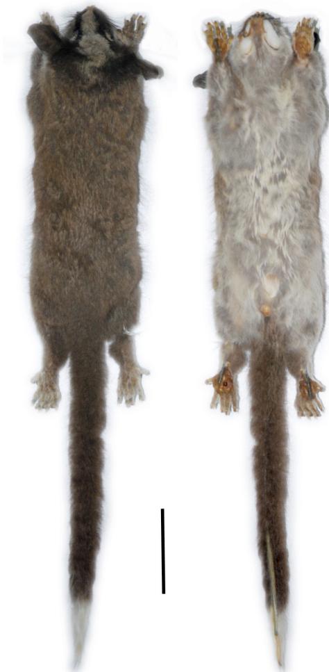
Fig. 1. Vista dorsal y ventral de la piel de Glironia venusta (MEPN 12083), colectada en San Antonio, Refugio de Vida Silvestre El Zarza en la cordillera del Cóndor, Ecuador. Barra = 30 mm.