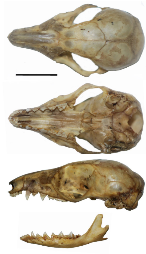
Fig. 2. Vista dorsal (arriba), ventral (medio) y lateral (abajo) del cráneo de Glironia venusta (MEPN 12083), proveniente de San Antonio, Refugio de Vida Silvestre El Zarza en la cordillera del Cóndor, Ecuador. Barra = 10 mm.

región. Es necesario resaltar que los registros del norte de Perú son de bosques húmedos tropicales, mientras que los de la cordillera del Cóndor son de bosques montanos (Fig. 3).