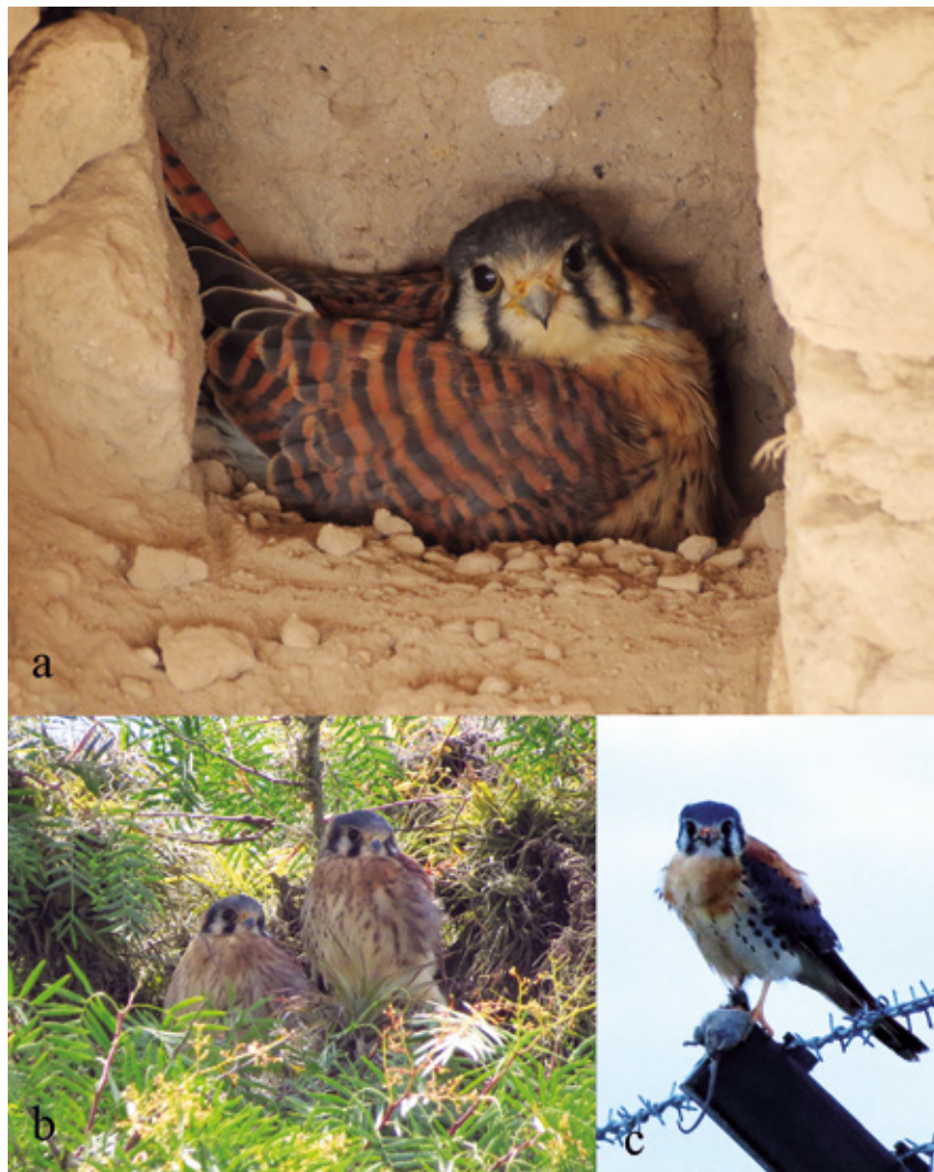
Figura 1. Individuos de Falco sparverius fotografiados en la localidad Tababela, donde fueron colectadas egagrópilas: a) Hembra anidando en pared de casa abandonada, b) jóvenes perchados en vegetación adyacente a casa, c) macho adulto acabando de cazar un roedor Phyllotis haggardi .

Entre septiembre del 2013 y septiembre del 2015, colectamos egagrópilas en dos localidades en la provincia de Pichincha (ubicadas en el piso Zoogeográfico Templado; Albuja et al. 2012) durante visitas esporádicas a dos localidades (Tabla 1): (1) casa antigua Caraburo, adyacente al Aeropuerto Internacional Mariscal Sucre en la parroquia Tababela (0°07'51.11"S, 78°21'6.31"W, 2371 m) allí predominan arbustos nativos como Acacia sp., Opuntia sp. y Croton sp., donde registramos a una familia de Falco sparverius (Fig. 1); y (2) Sangolquí, zona urbana ubicada al sureste de la ciudad de Quito (0°19'34.19"S,