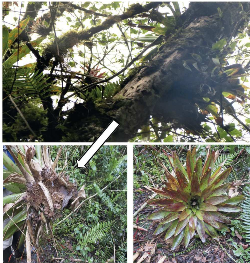
Figura 4: Bromelia desprendida de un árbol de ca. 10 m de alto donde se encontraron dos individuos de Pristimantis acerus (la flecha indica el lugar donde estaban los cutines).