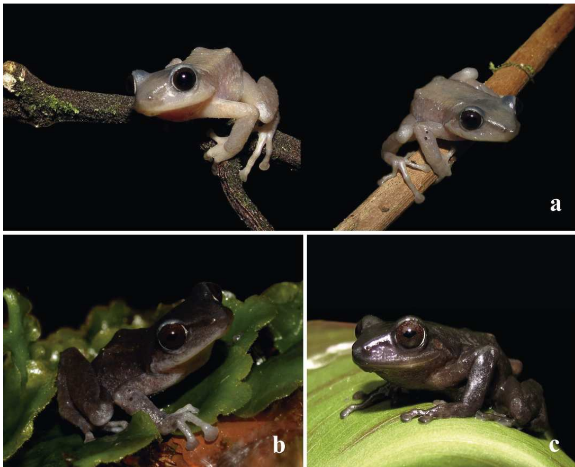
Figura 2: Cambios de coloración en vida de un individuo de Pristimantis acerus (DHMECN 12058, macho adulto, longitud rostro-cloacal = 32,5 mm) encontrado en Guango Lodge, Napo, Ecuador. a) Individuo exhibiendo cambios en el patrón de coloración al momento de su captura; b) coloración oscura dorsal pero ventral clara después de 30 minutos luego de su captura. c) coloración oscura dorso-ventral al día siguiente de su captura, durante la mañana.